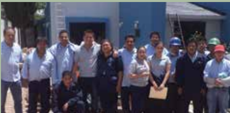
Mantenimiento a la Casa de Salud de la comunidad San Marcos Contla, Tlaxcala.