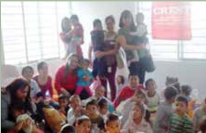
Programa de apoyo al Centro de Adaptación y Atención al Menor, A.C. en Santa Catarina, NL.